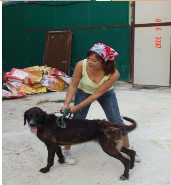
(Laura e Nando; Federica e Neve; Federica e Turchia)

La Disposizione nel Furgone dei trasportini di diversa misura (a seconda della grandezza e del peso specifico del corpo dell'animale) conteneti i cani