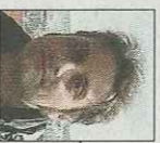
di SIMONE STIMOLO

La bella scoperta di avere un amico a quattro zampe